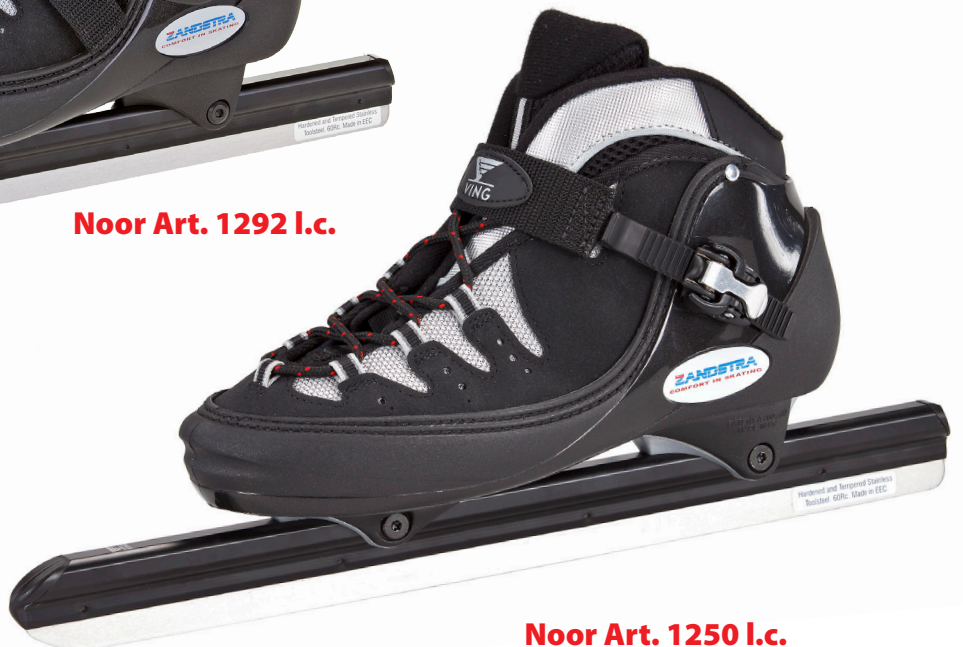
Noor Art. 1250 I.c.