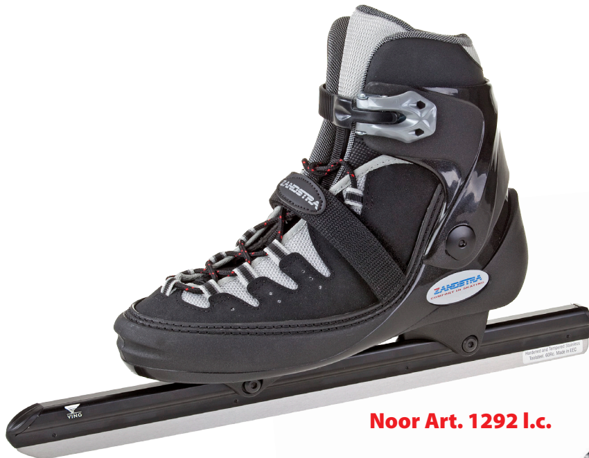
Noor Art. 1292 I.c.